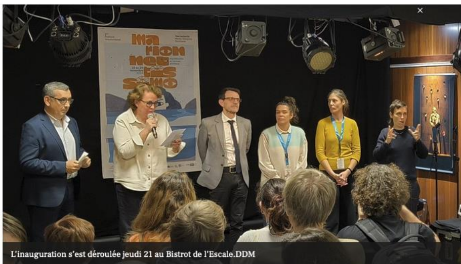
L'inauguration s'est déroulée jeudi 21 au Bistrot de l'Escale.DDM