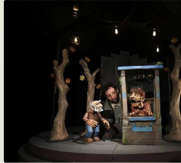
Chemin des métaphores Cie Singe Diesel • © Thomas Kerleroux.