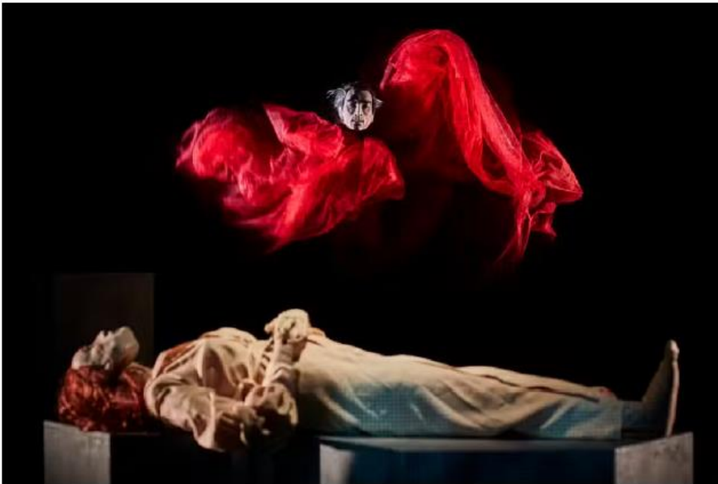
« Dracula Lucy's Dream ».